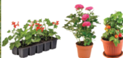
VSE ZA VAŠ ZELENJAVNI IN OKRASNI VRT