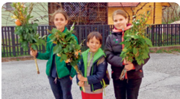
Izdelava butaric na Spodnji Slivnici