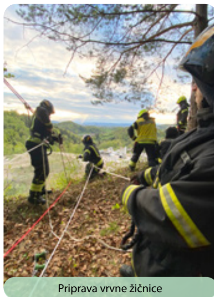
Priprava vravne žičnice

Za uspešno delovanje prostovoljnih gasilcev je prav gotovo potrebna profesionalna gasilska oprema, ki pa je brez vrhunsko usposobljenih gasilcev lahko le mrtev kapital v gasilskih domovih. Da lahko gasilci uspešno intervenirajo in rešujejo v različnih intervencijah, se morajo stalno izobraževati in usposabljeni. Poleg rednega izobraževanja na tečajih imajo velik pomen tudi praktične vaje, skozi katere se gasilci pripravljajo za različne in praviloma vnaprej nepoznane situacije in nesreče. Za gasilce požari niti niso najpogostejši primer posredovanja.