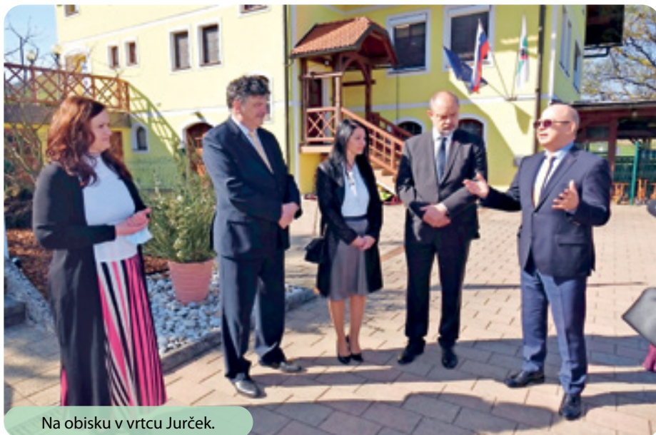
Na obisku v vrtcu Jurček.

»Rad bi izrazil našo hvaležnost Sloveniji, vsem Slovenkam in Slovencem, vladi države, vodstvu države. Res sem ponosen, da svoje delo opravljam v Sloveniji. Nekateri radi pravite, »mi smo majhna država«, vendar ne, v teh časih ste za Ukrajino, v našem boju, v podpori naši državi, v prvi