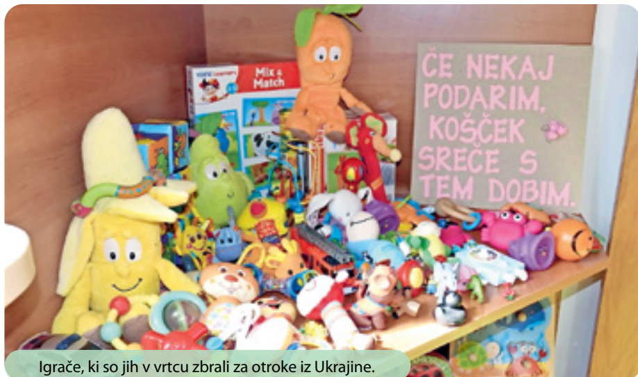
Igrače, ki so jih v vrtcu zbrali za otroke iz Ukrajine.