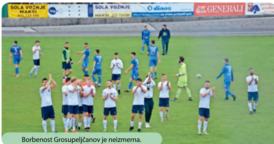
Borbenost Grosupeljčanov je neizmerna.