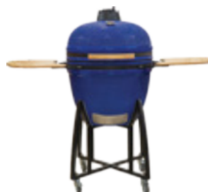
KAMADO RAMDA ŽARI