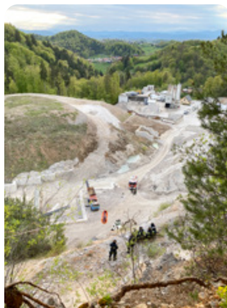
Spuščanje ponesrečenca z vravno žičnico

m pod vrhom kamnoloma in cca 50 m nad spodnjim delom kamnoloma in je nedostopna iz vseh smeri. Tretji fant je poklical 112 – ReCo Ljubljana in prosil za pomoč.