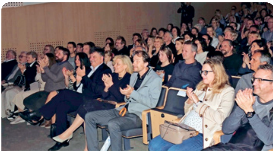
Polna dvorana navdušenih obiskovalcev