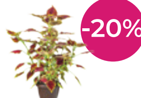
RASTLINA MESECA MAJA OKRASNA PRAPROT