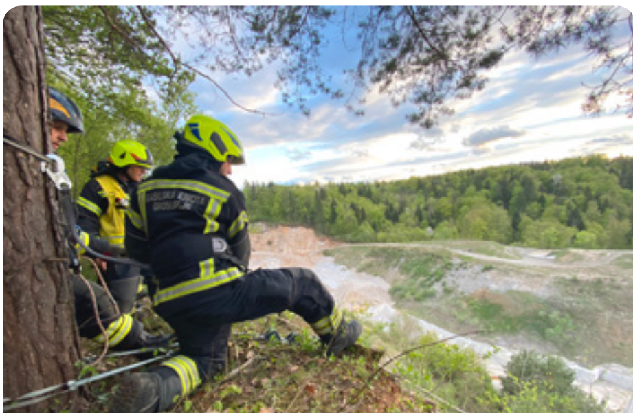
Varovanje spuščanja nosil s ponesrečencem po vrvni žičnici