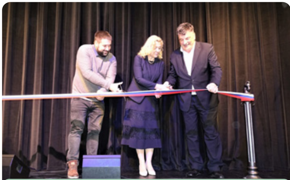
Slovesen prerez traku ob otvoritvi prenovljenega Kulturnega doma Grosuplje.

Težko obdobje epidemije novega koronavirusa covid-19, še posebej za tiste, ki smo radi v družbi, ki nam družabno življenje veliko pomeni, ki se radi udeležujemo različnih prireditev, dogodkov, pa najsi bodo športni, kulturni, je v večji meri le za nami. Verjamemo, da je tako. Smo pa to obdobje, kolikor se da dobro izkoristili in prenovili notranjost Kulturnega doma Grosuplje. Prenovljena dvorana nam je še bolj dala vedeti, kako manjkajo nastopajoči, kako manjkajo obiskovalke in obiskovalci. Vendar pa je prišel čas, da lepa, moderna dvorana na široko odpre svoja vrata za vse nas, napovedan koncert Big banda Grosuplje pa je bil lepa priložnost, da s simboličnim prerezem traku prenovljen kulturni dom tudi uradno predamo svojemu namenu.