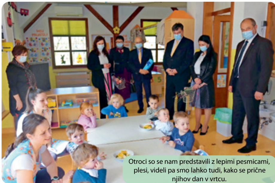
Otroci so se nam predstavili z lepimi pesmicami, plesi, videli pa smo lahko tudi, kako se prične njihov dan v vrtcu.